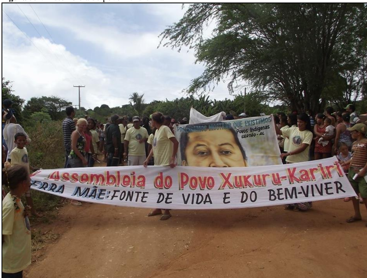
Figura 5: V Assembleia do povo Xukuru-Kariri

A reinvidicação dos Xukuru-Kariri era buscar junto à sociedade envolvente uma justiça social para todos, obtendo o direito ao território tradicional como definiu a Constituição Federal do Brasil de 1988 e a Organização Internacional do Trabalho/OIT que seguiram a mesma perspectiva na ideia de que os indígenas possuem uma relação especial com terra, envolvendo aspectos sociais, econômicos e culturais. Com o intuito de expor como se constituíam as assembleias, a imagem a seguir exprime parte das pessoas que fizeram parte da V assembleia Xukuru-Kariri, com cartazes que traziam referências as lideranças (figura 5).