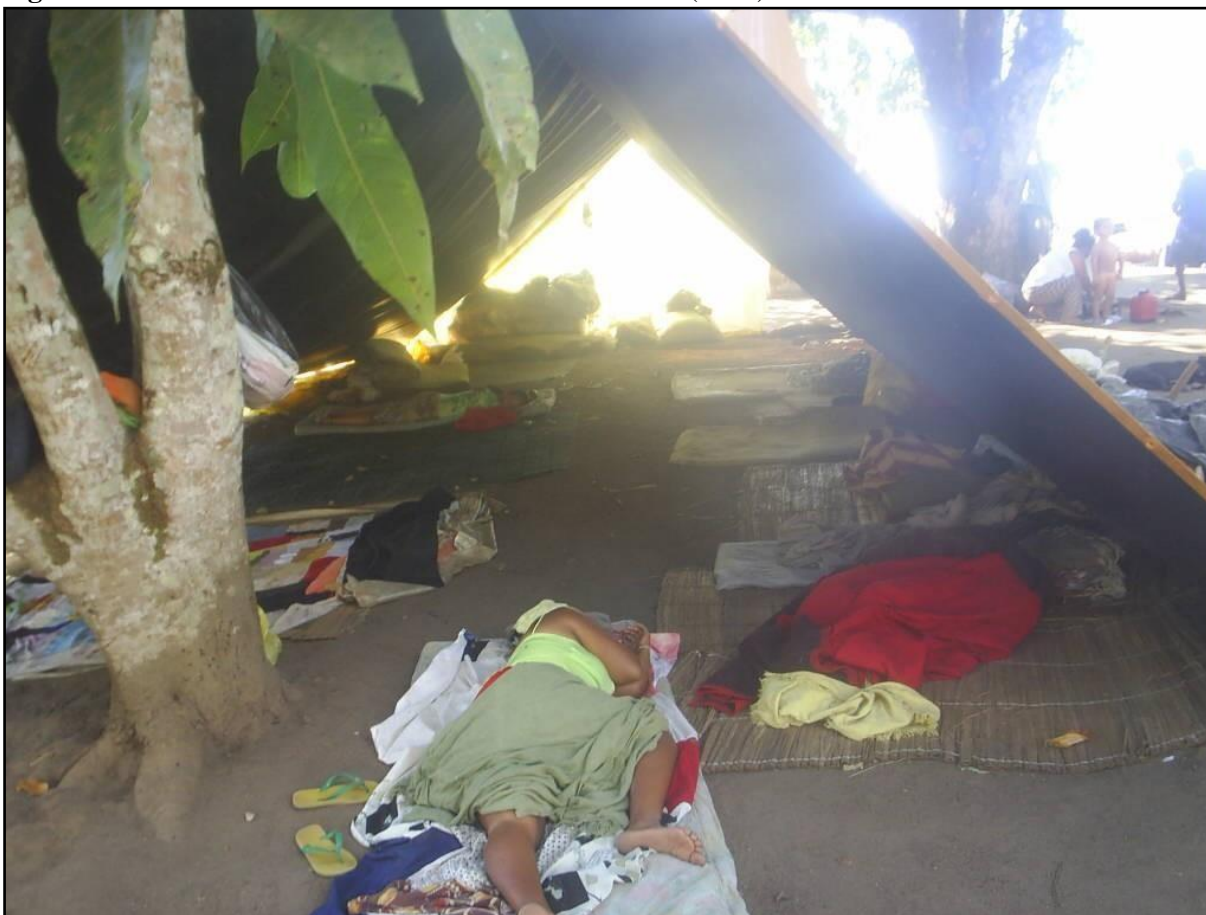
Figura 3: Última retomada territorial da Mata da Cafurna (2008)