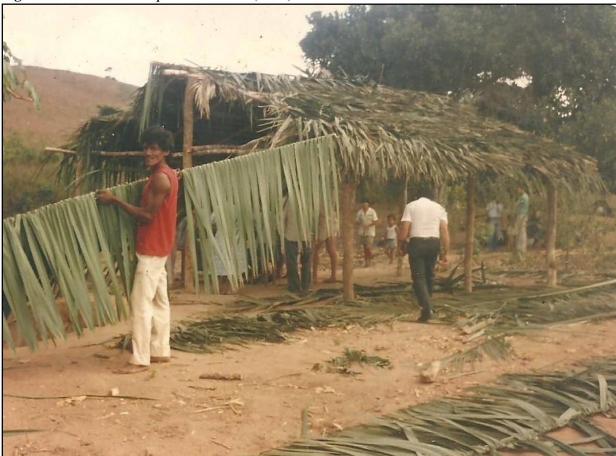
Figura 2: Primeira reconquista territorial (1979)