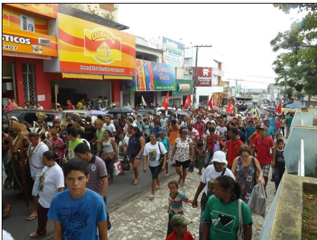
Figura 6: Movimento Grito dos Excluídos

Na imagem a seguir, figura 6, identificamos o momento em que a mobilização tomou as ruas da cidade. A população envolvente se misturava ao movimento e acabava aderindo a reivindicação. Uma caminhada pacífica e democrática, pois todos tinham direito de exercer sua cidadania e solicitar uma postura dos órgãos públicos na efetivação dos direitos; os participantes tinham vozes ativas.